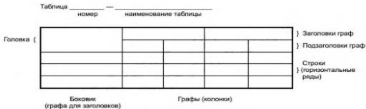
Рисунок 2 – Основные элементы таблицы

Основные элементы таблицы представлены на рисунке 2.