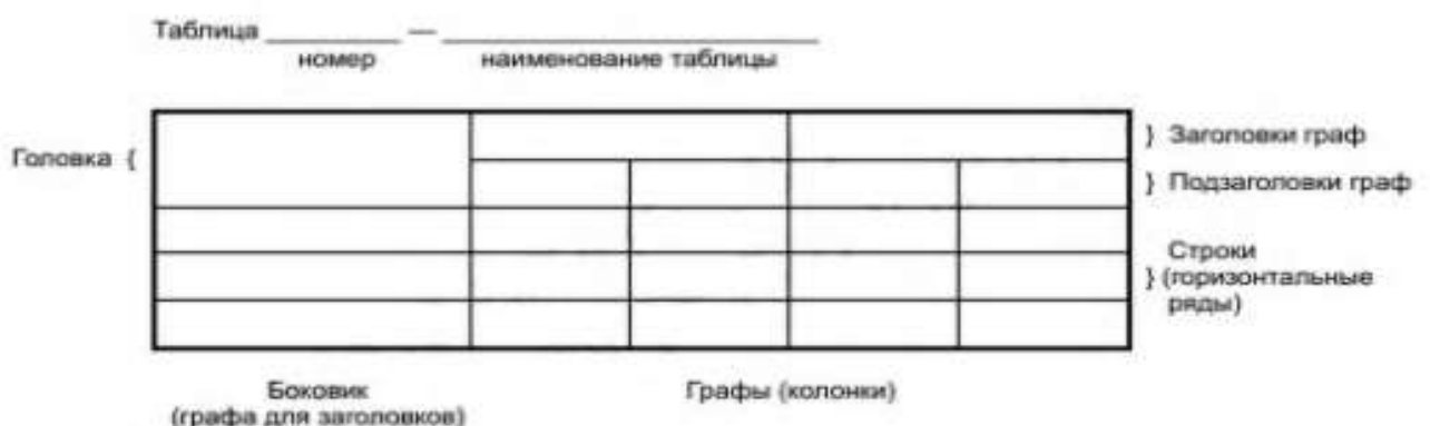
Рисунок 2 – Основные элементы таблицы

Таблицу необходимо располагать непосредственно после текста, в котором она упоминается впервые, или на следующей странице. На все таблицы в отчете должны быть ссылки. При ссылке необходимо печатать слово «таблица» с указанием ее номера: например, «представлено в таблице 1».