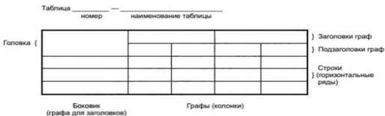
Рисунок 2 – Основные элементы таблицы

Основные элементы таблицы представлены на рисунке 2.