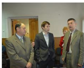
Обсуждение технических возможностей 3D принтеров