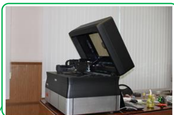
3D принтер Objet 30 Pro