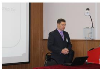
С приветственным словом и докладом о направлениях деятельности Брянского ОЦНИТ выступает директор Брянского ОЦНИТ